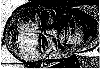
Poul Larsen. Ansvarlig for volleyball